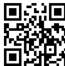
QR Code 報名連結

二、全程參加活動並完成認證考試者參加110年4月25日(六)講習班者頒發6小時訓練時數證明，會後考試合格者於考試及格證書加發2小時(共計8小時)。如當日遲到或早退者將不予計算學分，敬請學員配合。本課程亦申請西醫師繼續教育積分。